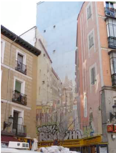
Calle de la Cruz

Otro, muy imaginativo, en la calle de la Montera también, y un mural en pleno Rastro, en la plaza de Cascorro, lleno de "trastos", como el propio mercado.