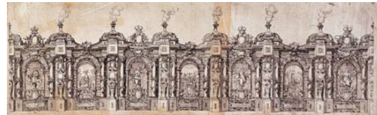
1680 Estampa calcográfica, aguafuerte, 262 x 805 mm

Un ejemplo: en 1680, se construyó la Galería o Calle de los Reinos, arquitectura fingida levantada para decorar el recorrido de la entrada en Madrid de María Luisa de Orleans, futura esposa de Carlos II, a la salida del Real Sitio del Buen Retiro, en el paso que comunicaba el palacio con el Prado de San Jerónimo. Su traza fue obra de Claudio Coello y José Donoso, pintor.