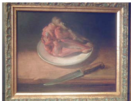
F. Cerezo. "Cabeza de Cordero" 1

Desde el pasado 24 de octubre al 7 de enero, hemos tenido ocasión de poder visitar una exposición en el Museo del Prado sobre Bodegones españoles con un título muy significativo, "Lo fingido verdadero", tomado de una obra de Lope de Vega. La Cabeza de cordero pintada por Francisco Cerezo Moreno es un magnífico ejemplo del bodegón barroco español que recurre al trampantojo, al efecto de engaño visual, la hoja del cuchillo parece que se sale del cuadro, que quiere salirse del marco.