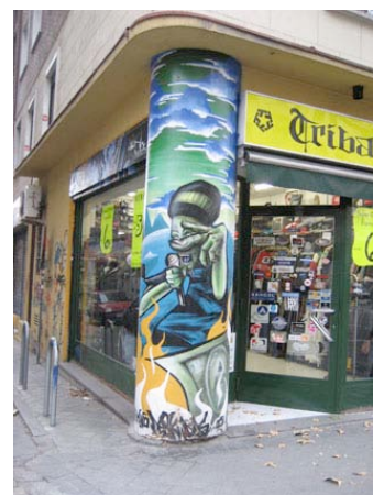
Graffiti en la Calle del Doctor Esquerdo, 33

Podríamos decir que se trata de un recurso artístico muy distinto a los graffiti, ya que únicamente busca decorar, alegrar, mejorar, de una forma constructiva, cosa que no siempre ocurre en el otro caso.