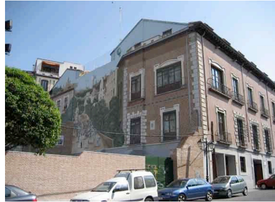
Carrera de San Francisco

subiendo por la cuesta de la Carrera de San Francisco, a espaldas de la iglesia de San Andrés. Resulta difícil diferenciar la falsa fachada de la verdadera.