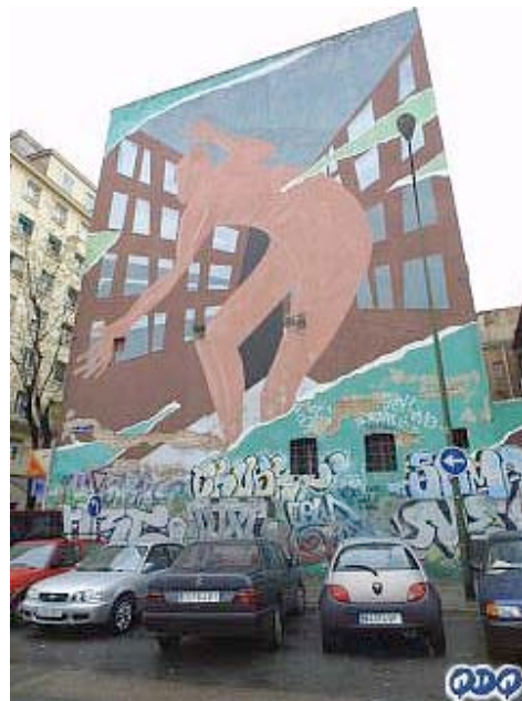
Calle Fernández de la Hoz, 63