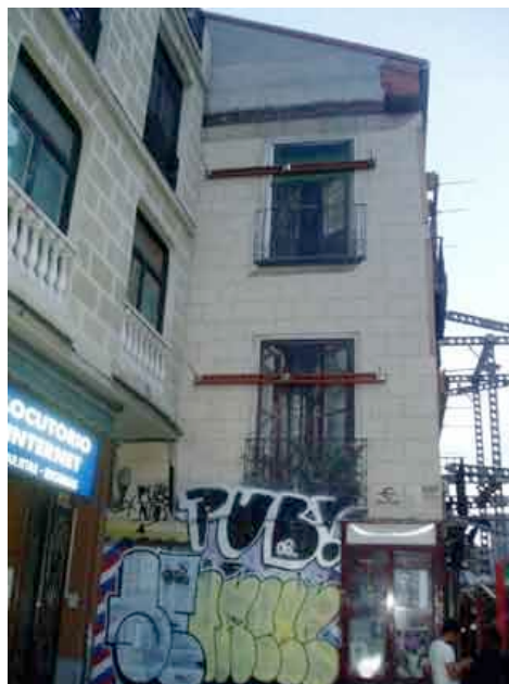
calle de San Bernardo