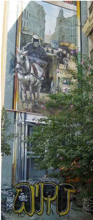
Calle de la Montera

Hay preciosos trampantojos por toda la ciudad, y no únicamente en el centro. En la calle Azcona, esquina con Francisco Silvela, algo deteriorado: