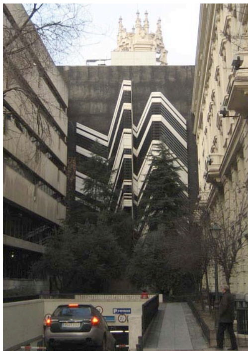
Calle Alfonso XI

Y por fin, en la calle Alfonso XI, bajando desde el Retiro por la calle Valenzuela vemos un trampantojo con el palacio de Correos al fondo, más emparentado con el arte moderno que ninguno de los visitados hasta el momento. Simula altos edificios en blanco y negro, y es de los más fotografiados y a menudo utilizado en películas y spots publicitarios.