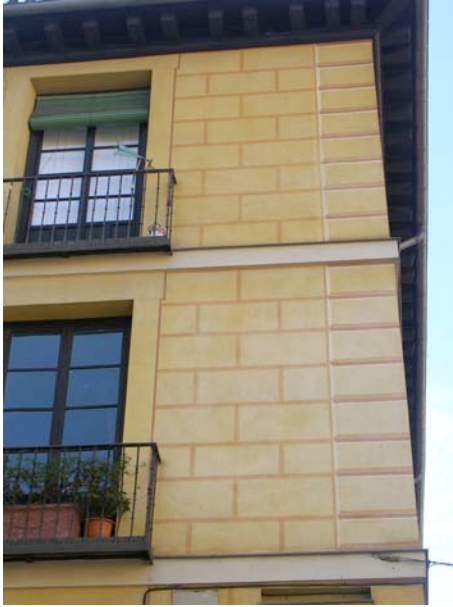
Costanilla de San Andrés

Los personajes creados por Antonio Mingote asomándose a los balcones de la Calle de la Sal, a un paso de la Plaza Mayor; o incluso decorando una lona publicitaria que cubre una obra en la calle de la Escalinata: