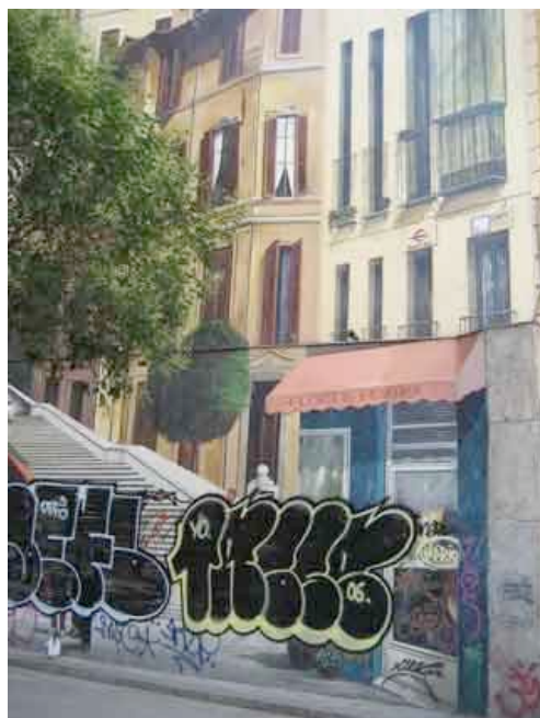
Calle de la Montera, 22

Muchos de los mejores trampantojos madrileños están manchados por los graffitis.